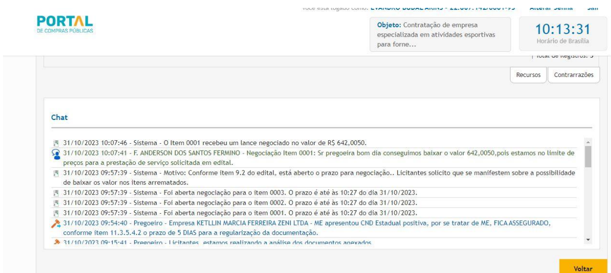
Figura 1 – Print realizado chat da concorrência pública acima citada.

Levando em consideração os itens do edital que tratam sobre a DESCLASSIFICAÇÃO dos participantes deste pregão, o arrematante do Item não cumpriu com o que foi exigido via CHAT e edital, pode-se analisar abaixo: