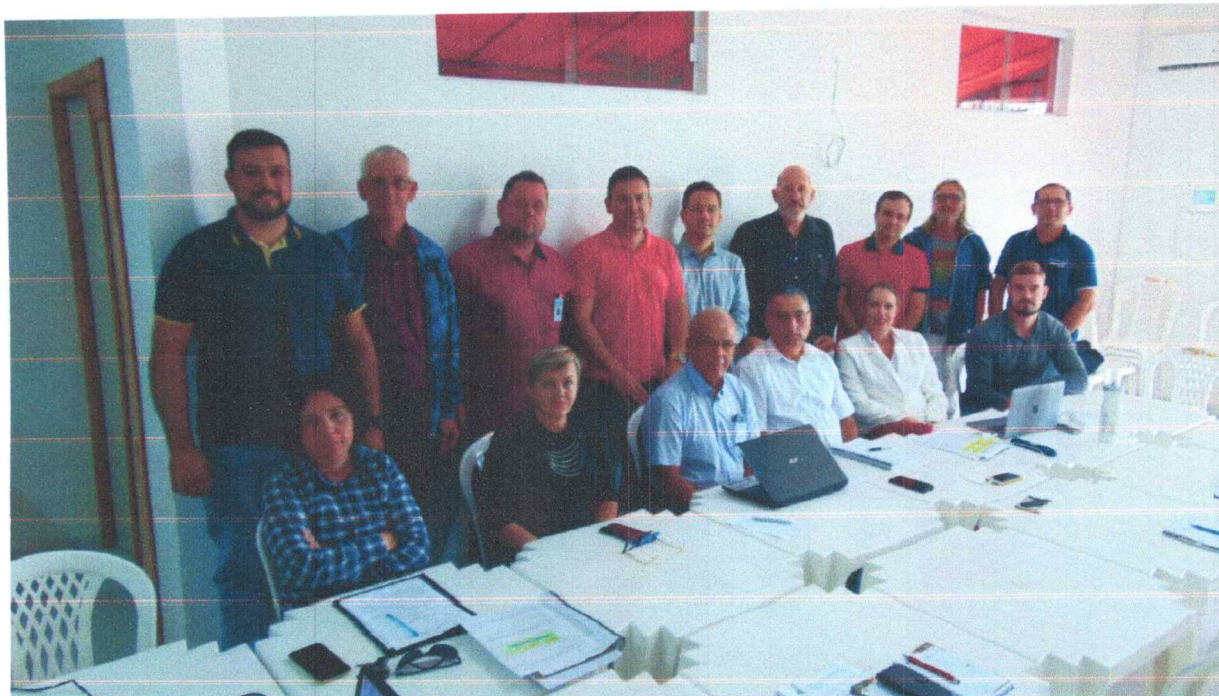
3ª Reunião Ordinária de 2017, quando os novos conselheiros do Biênio 2017-2018 tomaram posse (12/05/2017).