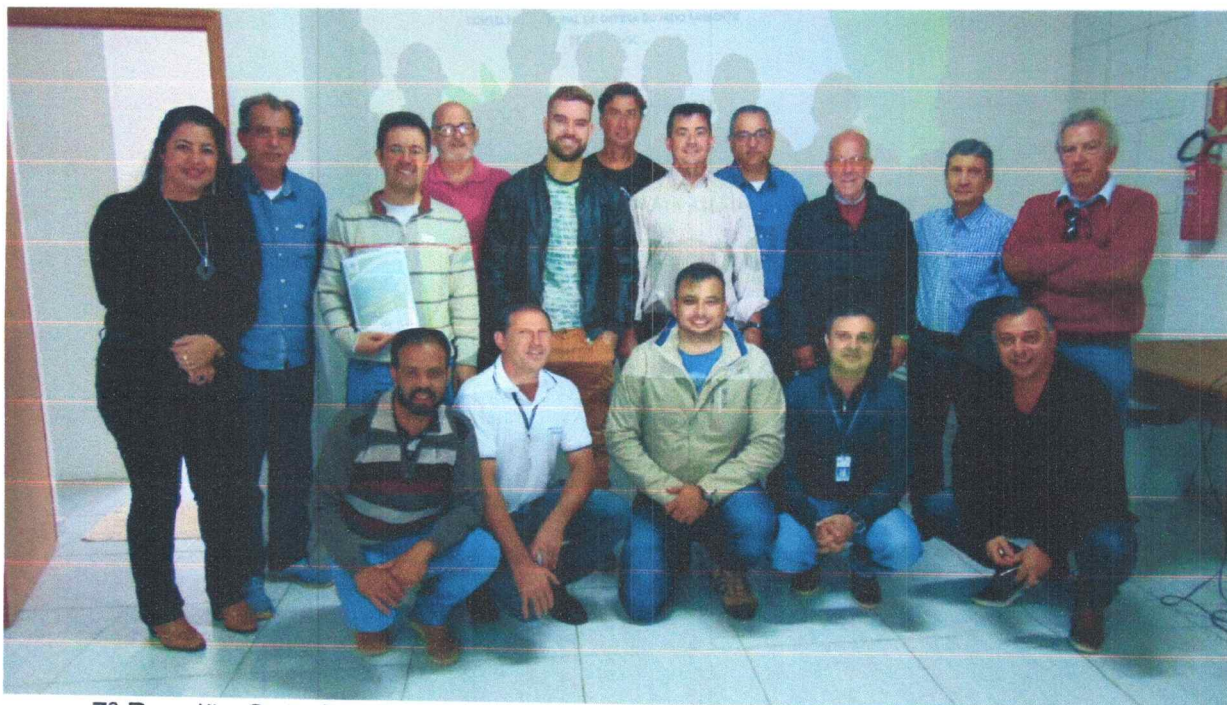
7ª Reunião Ordinária de 2018, quando o Conselho aprovou o Plano Municipal de Conservação e Recuperação da Mata Atlântica 14/09/2018.