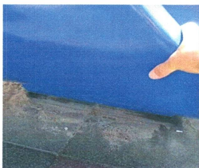
A gangorra está quebrada no ponto de solda.