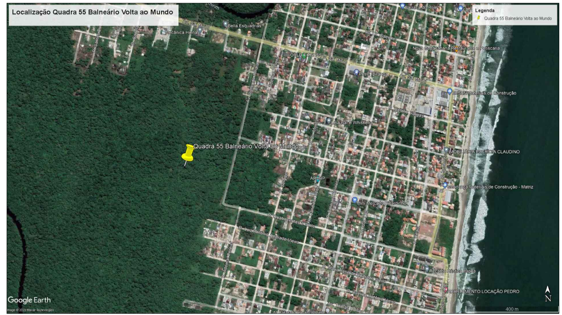
Vista de Situação Sem escala