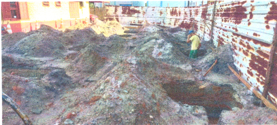
Figura 4- Aferição Gabarito