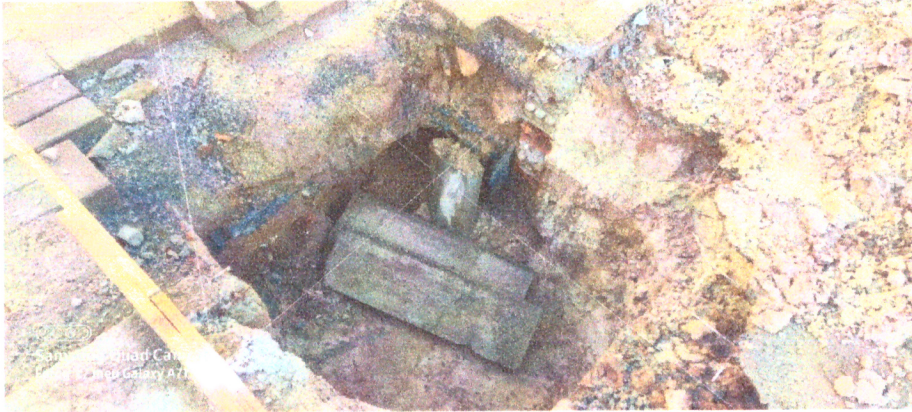
Figura 2- Local S3