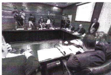
Reunião da CCJ

Apos intensos debates, a Comissão de Constituição e Justiça (CCJ) admitiu, na manhã desta terça-feira (28), a Proposta de Emenda à Constituição (PEC) 1/2019, que altera o artigo 128 da Constituição Estadual com o objetivo de proibir a cobrança de taxa de qualquer natureza que limite o tráfego de pessoas ou de bens.